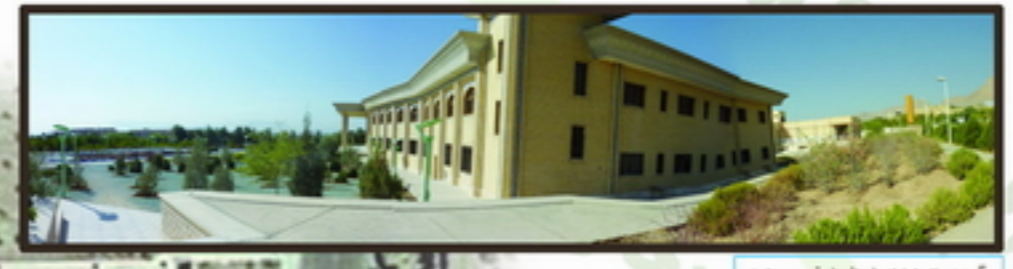
5 دید پانوراما از شمال شرقی به سایت دسترسی نامطلوب