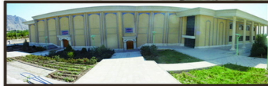
4 دید پانوراما از ورودی سایت مجاور فضای اکولوژیک ضعیف