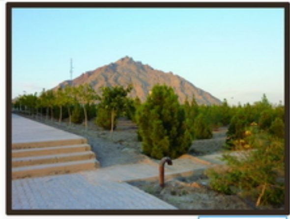
10 منظر ارزشمند پشت سایت