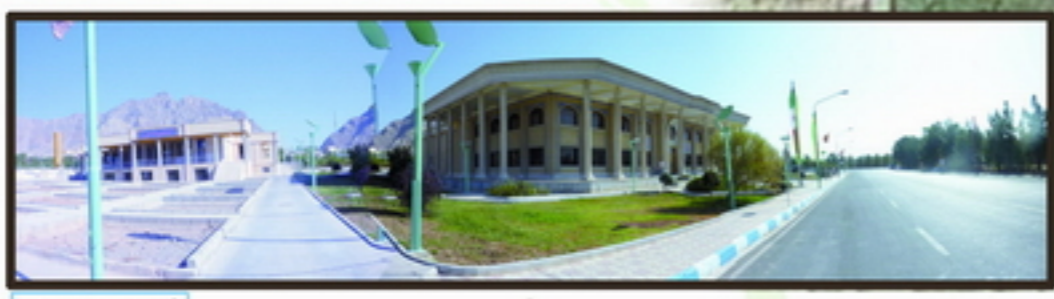
3 دید پانوراما از جنوب غربی دسترسی نامطلوب