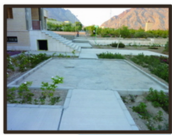
11 تغییرات فضای متعدد در مسیر حرکت غرب سایت