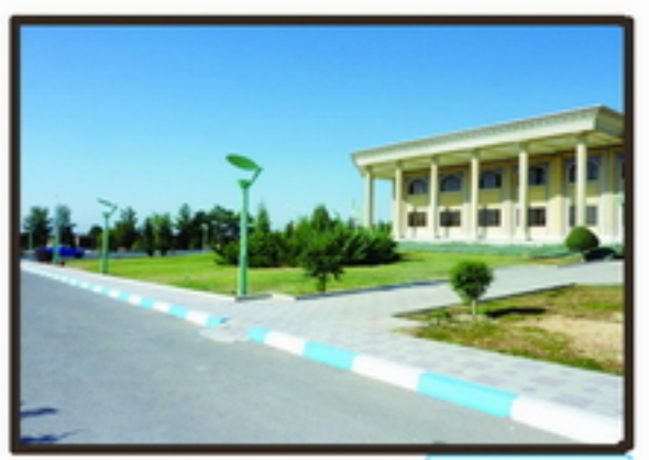
7 ورودی پارکینگ به سایت