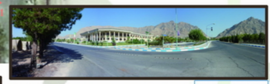
1 دید پانوراما از سمت جنوب شرقی فضای اکولوژیک محدود