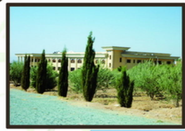
4 دید گسترده به سایت از پشت فضای اکولوژیک