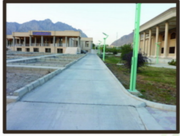
333 مسیر پیاده‌روی غرب سایت در انتها مسکون