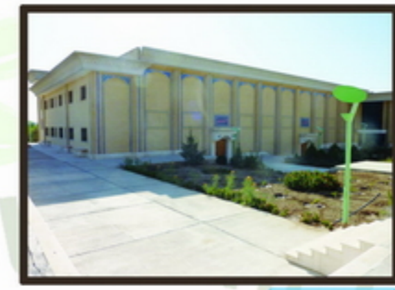
5 دید از پشت به سایت