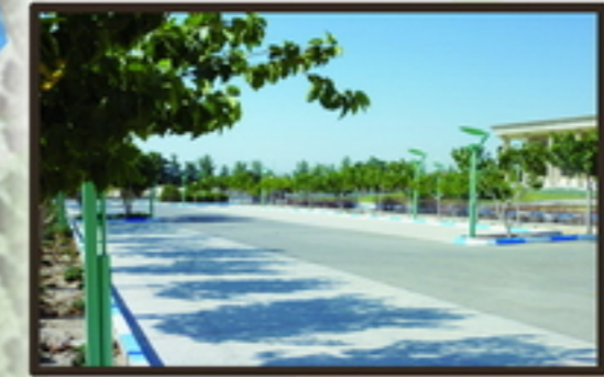
پارکینگ سایت فضای اکولوژیک نامناسب