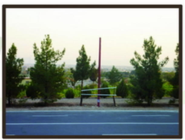
1 دید گسترده از سایت به شهر