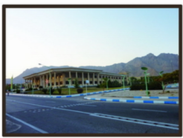
1 دید گسترده به سایت منظر مناسب