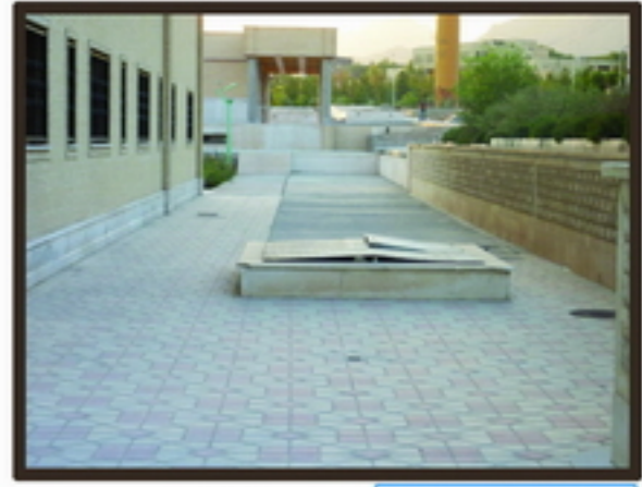
9 آغوشش بصری در محور پشت سایت