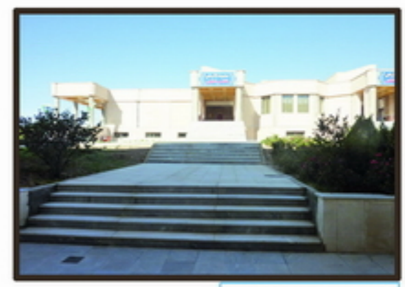
6 دید از داخل سایت به سایت مجاور