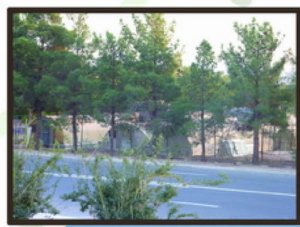
3 دید از سایت به جنوب آغوشش بصری ایجاد شده توسط سازه رو به روی سایت